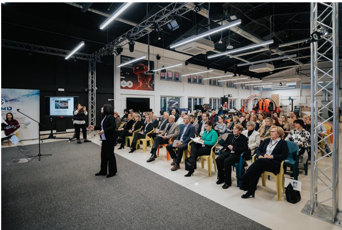
Konferencija 3. prosinca 2024. u prostoru Pismo2 u Novskoj

Zbornik radova je rezultat objavljenih radova koje je napisalo 16 autora i predstavilo na znanstveno-stručnoj konferenciji održanoj 3. prosinca 2024. godine. Konferencija "AKTUALNI TRENUTAK I PERSPEKTIVE OBRAZOVANJA U NOVSKOJ" održana je povodom obilježavanja 265. obljetnice školstva u Novskoj, 70. obljetnice osnivanja prve srednje škole u Novskoj, 50. obljetnice Dječjeg vrtića „Radost“ u Novskoj i 30. obljetnice Glazbene škole u Novskoj.