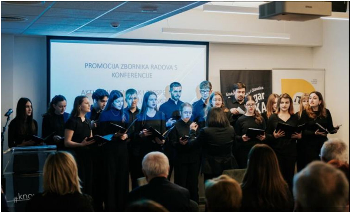
Zbor Glazbene škole Novska na otvaranju promocije